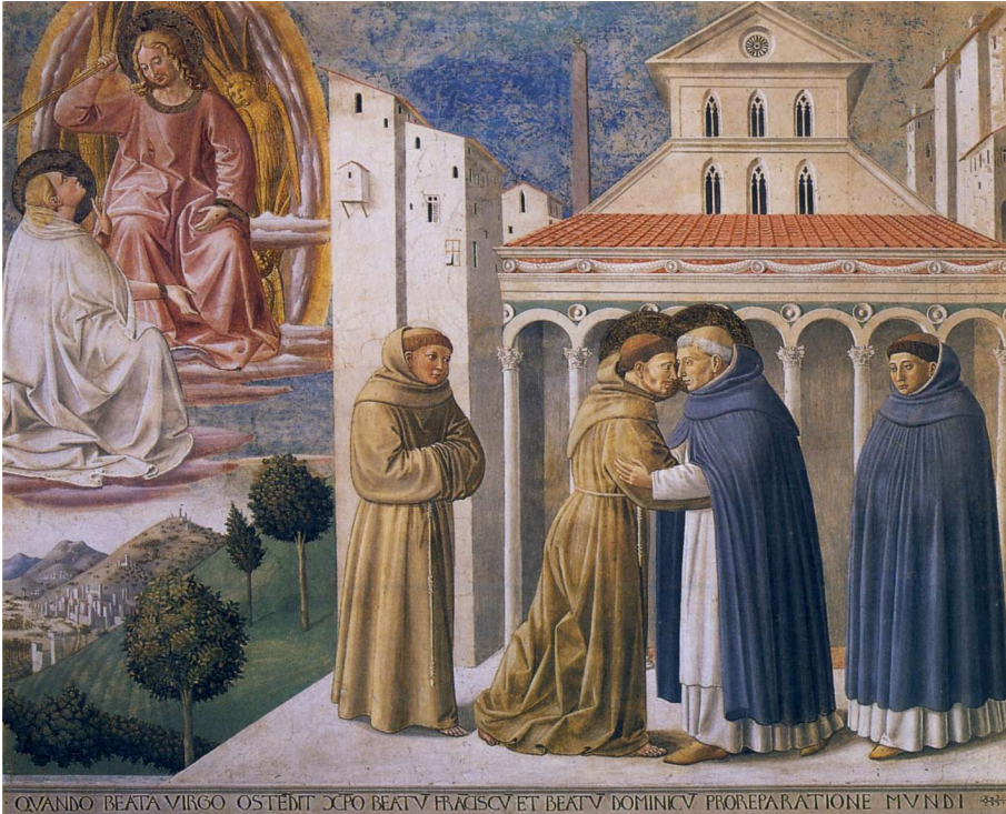
L'Abbraccio van Dominicus en Franciscus Fresco, 1452, Sint-Franciscuskerk te Montefalco

Franciscus van Assisi (Assisi 1182-1226) is de stichter van de Orde van de Franciscanen, auteur van het Zonnelied en de inspiratie voor onze huidige Paus Franciscus. Hij draagt zijn ruwe pij en koorden gordel met drie knopen “ con la cintura di corda a tre nodi ” [3] .