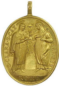
Kz.: Heilige Clara van Assisi en Heilige Catharina van Siëna

Hun voeten staan in dansende beweging tijdens de omarming, wat een ontmoeting! Bekijk het spel van de beweging van de handen en de armen, een knie vooruit, en de egale achtergrond.