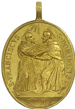
Vz.: L'Abbraccio van de HH. Dominicus en Franciscus 32×37 mm (met draaagoogje 46 mm)

Heel recent kreeg ik van een vriend uit Haasrode een zakje met dertig kleine medailles: “gij houdt dit toch bij, ge kunt dat wel eens nauwkeurig bekijken en iets mee doen”; daartussen bevond zich de lang gezochte medaille waarvan we alleen maar hadden kunnen vermoeden dat ze ooit had bestaan, nl. de gekende Abbraccio (omhelzing) van Franciscus en Dominicus.